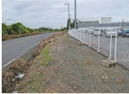
買収が進む歩道用地

答弁 蓮田サービスエリア(下り線)改築計画は、ネクスコ東日本が行う事業。従前の蓮田サービスエリア(上り線)を現在の蓮田サービスエリア(下り線)と一体で利用し、下り線専用のサービスエリアに改築する計画。蓮田スマートインターチェンジのフル化については、令和元年9月20日に国土交通大臣から連結許可が下り、新規事業化が採択されている。蓮田サービスエリア(下り線)の改築については、ネクスコ東日本が工事に向け詳細構造を検討している。蓮田スマートインターチェンジについては、ネクスコ東日本、埼玉県、蓮田市の3者で事業を進めている。現在の状況は設計が完了し、